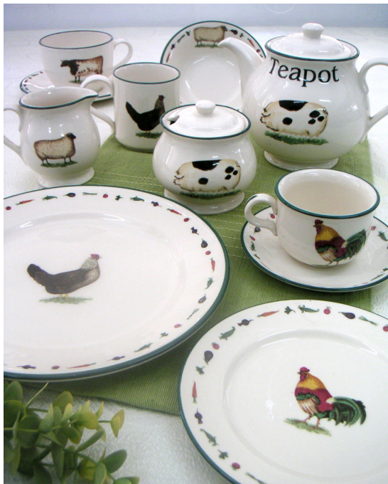
● 茶桌上的英式茶具，使人不自觉想起伦敦农场田园的午后，轻轻的倚在沙发的靠垫上，仿如农场的小动物即在眼前，玩起追赶跑跳碰的游戏，联想翩翩……