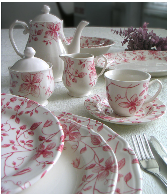
● 粉红花卉餐具设计，为厨房增添了田园风格。