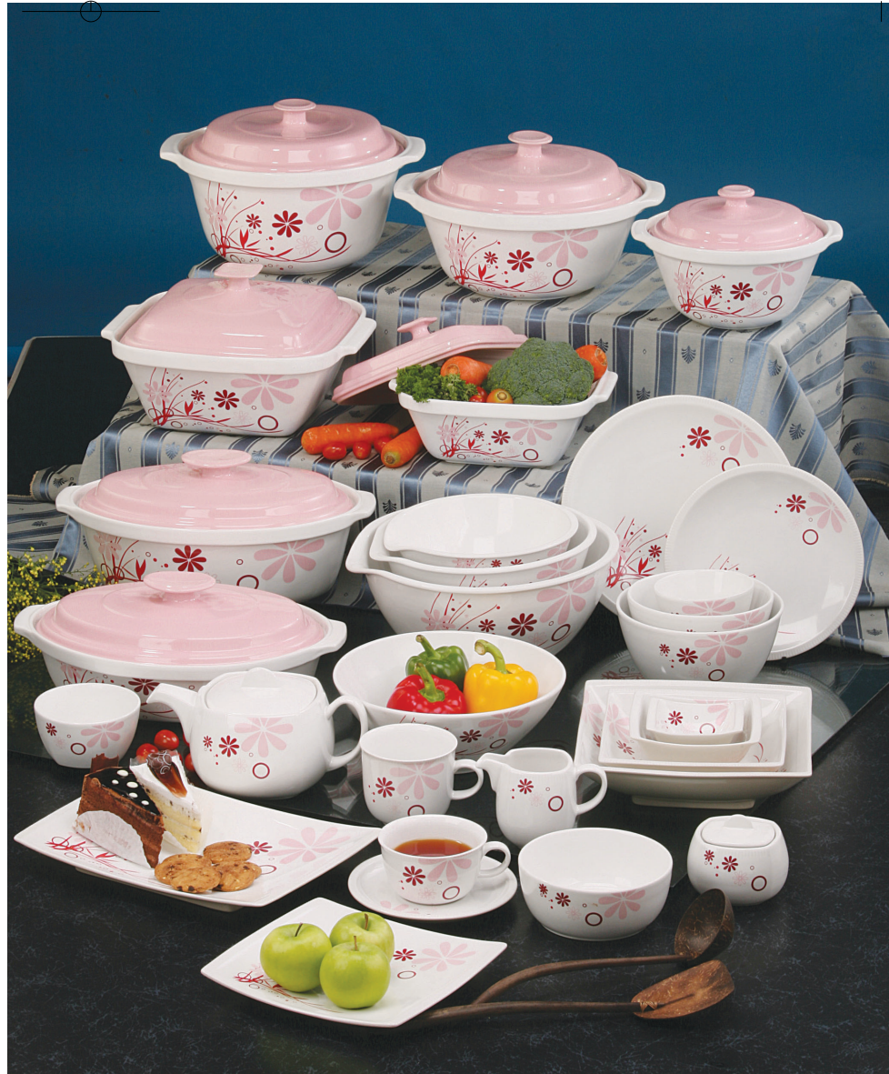
● 粉红色，可以诠释为少女的初恋情怀，也可以解说成优雅高贵的迷人风度。精美的厨房用具，在强调其实用的同时，也肩负充当家居装饰的角色。这套以粉色系列为概念，再搭配田园小花设计的厨具，肯定让你做个快乐的厨娘。