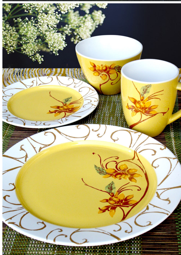
● 以缤纷色彩成为永垂不朽经典的峇迪设计，这回跳出服装的框框，走入陶瓷茶具的世界里，让你窥探其独一无二的魅力。